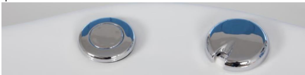
PULSANTE IDROMASSAGGIO (sinistra) + REGOLATORE INTENSITA' MASSAGGIO (destra)