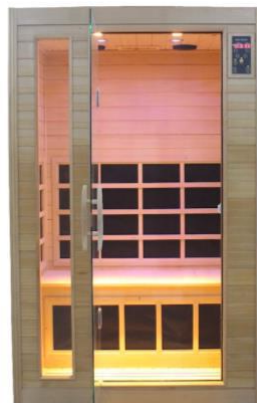
Sauna GOLD ECO

Per vedere tutti I modelli visita la sezione saune infrarossi